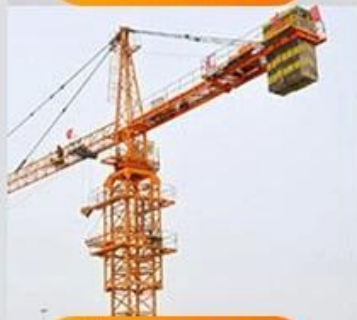
Tower crane construction equipment