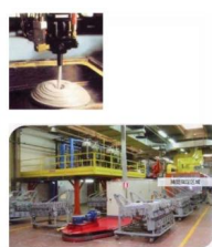
• PU Foaming Equipment PU(聚氨酯)发泡设备