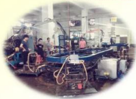
Lean Production Lines