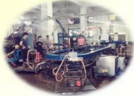
Lean Production Lines