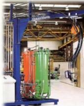
• PU Foaming Equipment