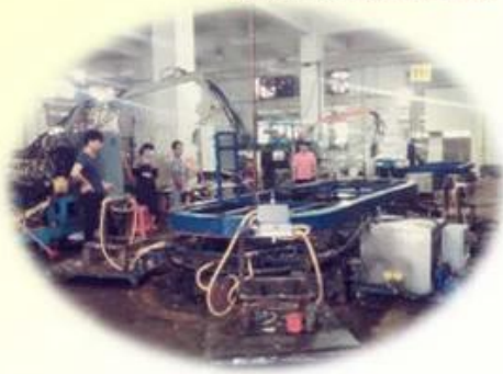
Wanliao Workshop 模具车间