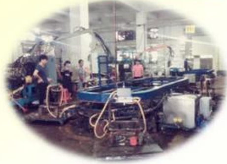
Lean Production Lines