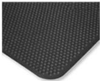
真空吸皮地垫 / 皮革地垫 PVC皮革+PU+SBR丁苯橡胶