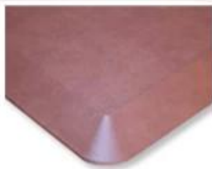
真空吸皮地垫 / 皮革地垫 PVC皮革+PU+SBR丁苯橡胶