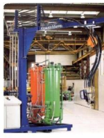
• PU Foaming Equipment PU(聚氨酯) 发泡设备