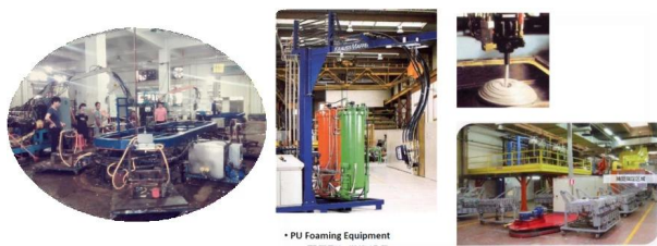
• PU Foaming Equipment PU(聚氨酯) 发泡设备