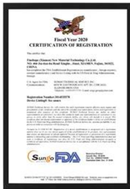
Сертификация Управления по контролю за продуктами и лекарствами

С 2019 года Finehope выбрана ведущей компанией Xiamen Science and Technology Little Giant. Этот сертификат был совместно выдан пятью департаментами муниципального правительства Сямьня. Критерии отбора сосредоточены на стратегических развивающихся отраслях, таких как информационные технологии нового поколения, высокотехнологичное оборудование, новые материалы, новая энергетика, биология и новая медицина, энергосбережение и защита окружающей среды, а также морские высокие технологии. Получение этой награды показывает, что Finehope находится в авангарде отрасли в области новых информационных технологий и новых материалов.