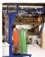
• PU Foaming Equipment (PU发泡机) 发泡设备