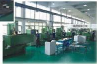
• PU Foaming Equipment

◆ Own the ability of independent improvement for the production equipments, and independent design and R & D ability of automatic moulds and jigs, lean automatic production lines.