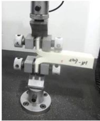
Tear Resistance Test