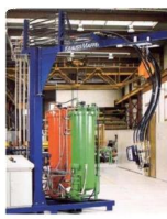
• PU Foaming Equipment PU(聚氨酯) 发泡设备