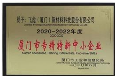
Xiamen: Spezialisierte, verfeinernde, differenzierende und innovative KMU