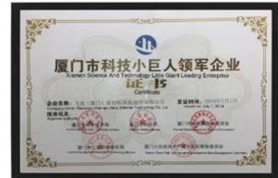
Xiamen Science and Technology Little Giant, führendes Unternehmen