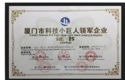
Xiamen Science and Technology Little Giant, führendes Unternehmen