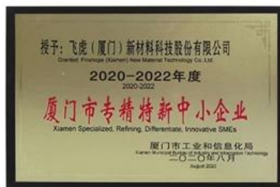
Xiamen especializado, refinando, diferenciadas, innovadoras.