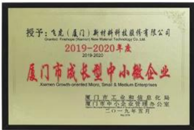
Micro de crecimiento, pequeñas y medianas empresas de Xiamen.