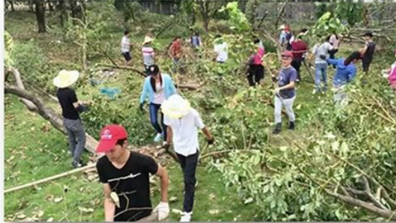
Voluntary tree planting after Super Typhoon Meranti in 2016