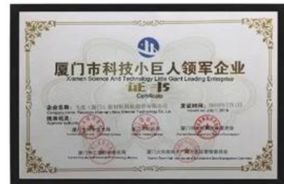
Xiamen Science and Technology Little Giant Empresa líder