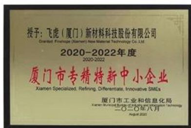
Xiamen Spécialisé, Raffinant, Différenciant, PME Innovante