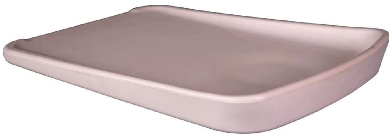
Table à langer de chambre de bébé en polyuréthane PU Kids Pad chambre de bébé Chine Fabricant Résistant à l'eau Lavable Babychanging Rembourré