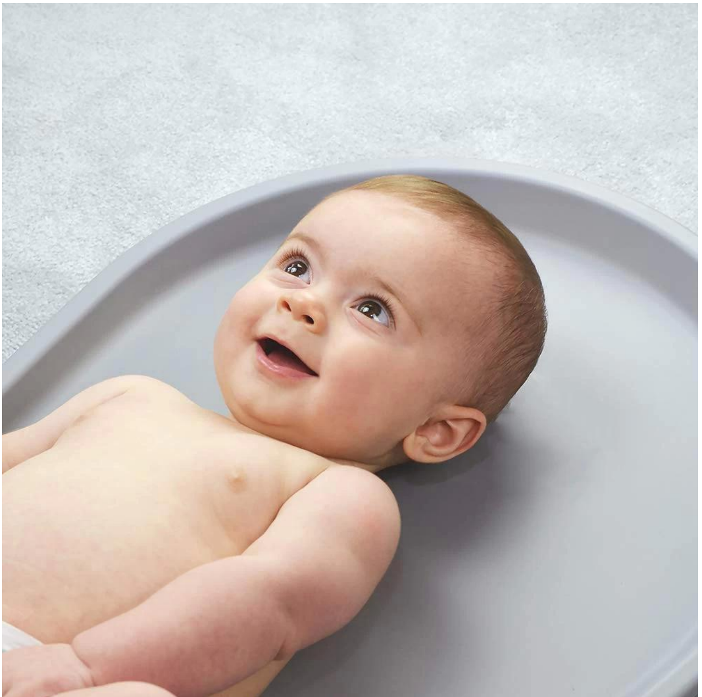
Ζεστό χαλί αλλαξιέρα βρεφικού κρεβατιού υψηλής πυκνότητας πώλησης για μωρό