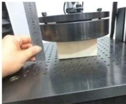
Indentation Force Deflection