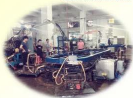
Lean Production Lines