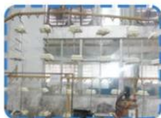
Painting production lines on the 1st Floor