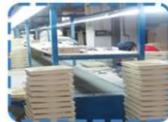
Polishing production lines on the 2nd Floor