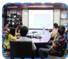
Xiamen University training course