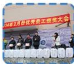
Excellent employee Award Presentation Ceremony