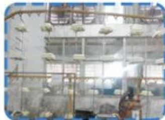
Painting production lines on the 1st Floor