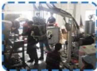
Lean production lines on 4th Floor