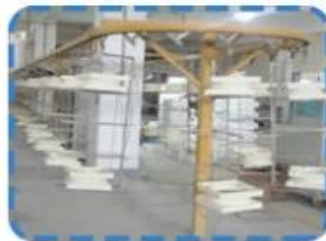
Cap & base products painting production lines on the 2nd floor