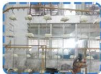
Painting production lines on the 1st Floor