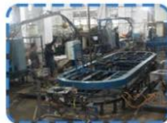
Cap & base sets production lines on the 1st Floor