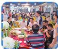
The Mid Autumn Festival