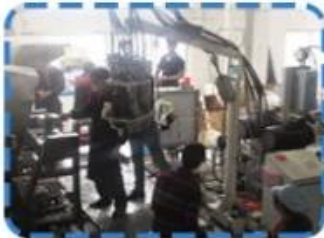
Lean production lines on 4th Floor