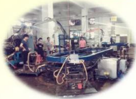
Lean Production Lines