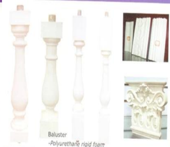
Baluster -Polyurethane rigid foam