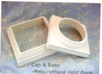
Cap & Base -Polyurethane rigid foam