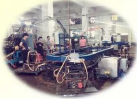
Lean Production Lines