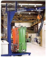
• PU Foaming Equipment PU(聚氨酯)发泡设备