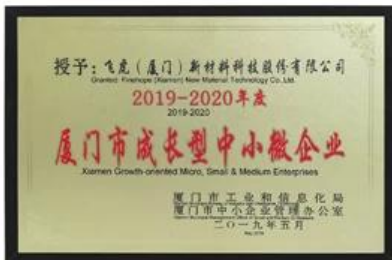
Xiamen Op groei gerichte micro-, kleine en middelgrote ondernemingen