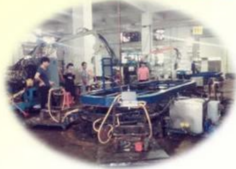
Lean Production Lines