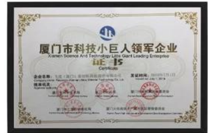
Xiamen Wetenschap en technologie Kleine gigantische toonaangevende onderneming