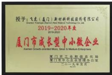
Xiamen Op groei gerichte micro-, kleine en middelgrote ondernemingen