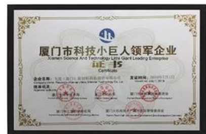
Xiamen Wetenschap en Technologie Kleine gigantische toonaangevende onderneming