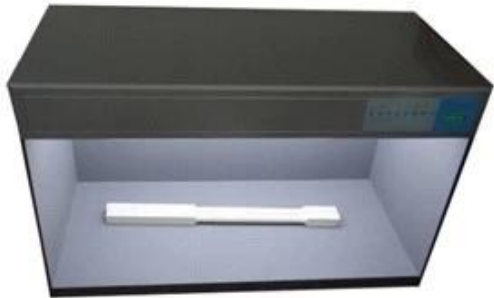
Standard Color compare Lighter box