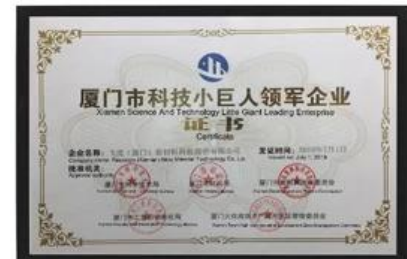
Xiamen Science and Technology Little Giant toonaangevende onderneming