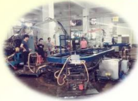
Lean Production Lines