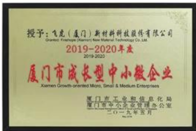
Xiamen Op groei gerichte micro-, kleine en middelgrote ondernemingen