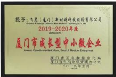
Micro, pequenas e médias empresas orientadas para o crescimento de Xiamen