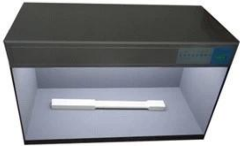
Standard Color compare Lighter box