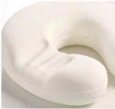
Details of springback