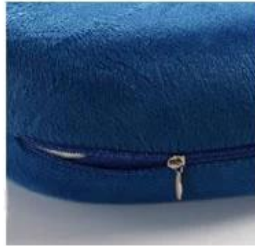
Details of zipper