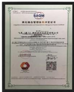
Сертификат системы управления интеграцией информатизации и индустриализации