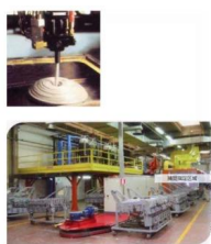
• PU Foaming Equipment PU(聚氨酯) 发泡设备