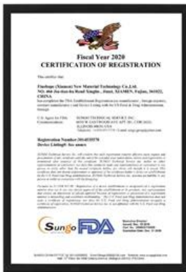
Сертификация Управления по санитарному надзору за качеством пищевых продуктов и медикаментов

С 2019 года Finehore была выбрана ведущей компанией Xiamen Science and Technology Little Giant. Этот сертификат был совместно выдан пятью департаментами муниципального правительства Сямьня. Критерии отбора сосредоточены на стратегических развивающихся отраслях, таких как информационные технологии нового поколения, высокотехнологичное оборудование, новые материалы, новая энергия, биология и новая медицина, энергосбережение и защита окружающей среды, а также морские высокие технологии. Эта награда показывает, что Finehore находится в авангарде отрасли в области новых информационных технологий и новых материалов.