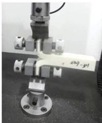
Tear Resistance Test