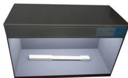
Standard Color compare Lighter box