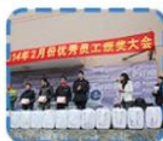
Excellent employee Award Presentation Ceremony